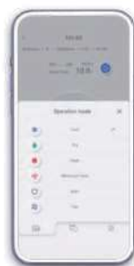
Cambio de modo

Un diseño elegante que se traduce en facilidad de uso. Se han aplicado cambios en el temporizador para una gestión de horarios sin esfuerzo.