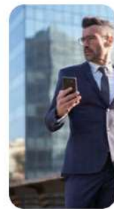
Propietario de un edificio comercial