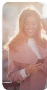
Propietario de vivienda