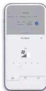
Cambio de velocidad del ventilador