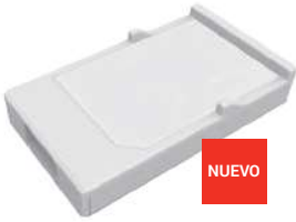
Tipo USB para modelos tipo Split (3IVN9145)

Airstage Mobile es una app que te permite controlar los climatizadores Fujitsu con el móvil desde cualquier sitio.