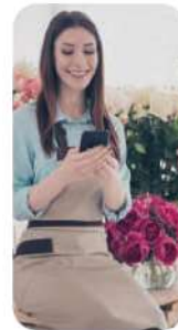
Propietario de un establecimiento